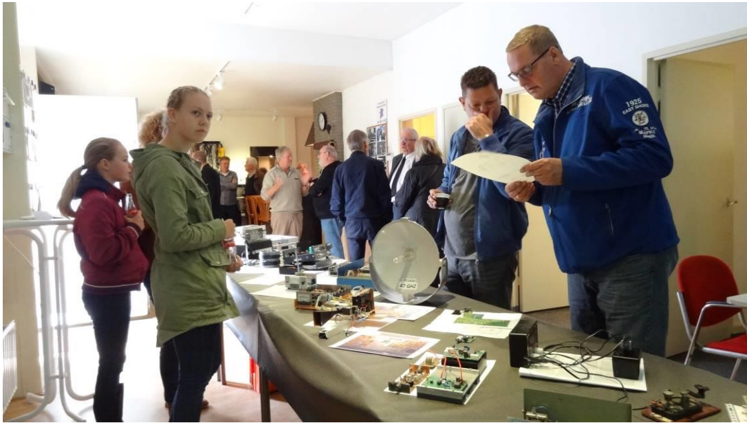
Familieleden meenemen naar de Open Dagen? Gezellig.....