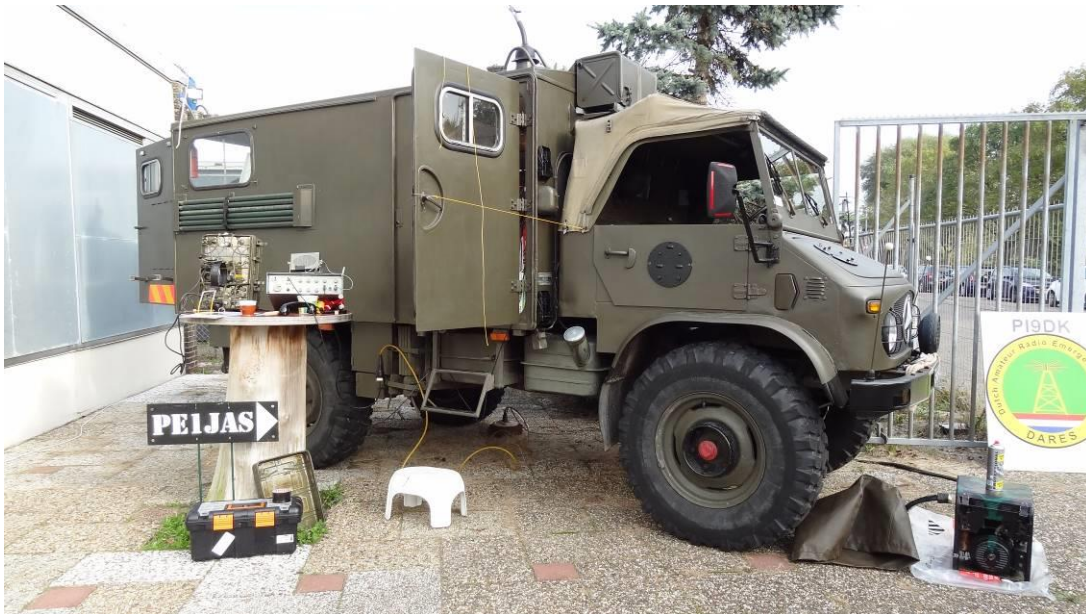
Groene spullen doen het nog steeds goed..